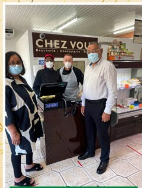
Boucherie Chez Vous - L. TOUZAÏN