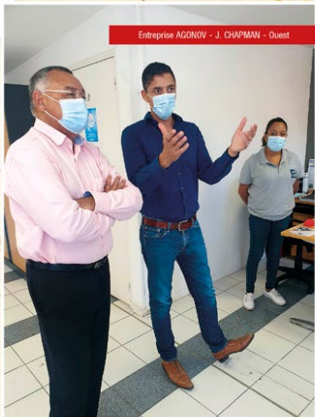
Entreprise AGONOV - J. CHAPMAN - Ouest