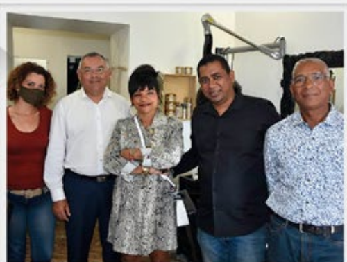
Coiffure Robert Émille, Sainte Anne