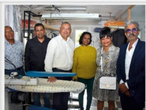
Pressing RAJADMA Saint-andré