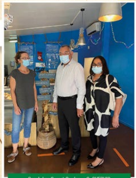
Snack bar Secret Garden - C. GUERHIC