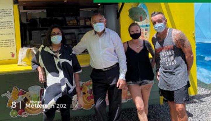
La Kaz à Fruit - C. GENICOT, Sud