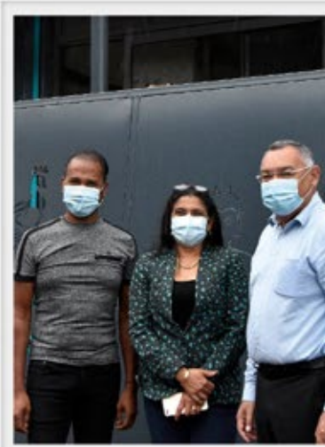
Ferronnerie PARAVEMAN - Est