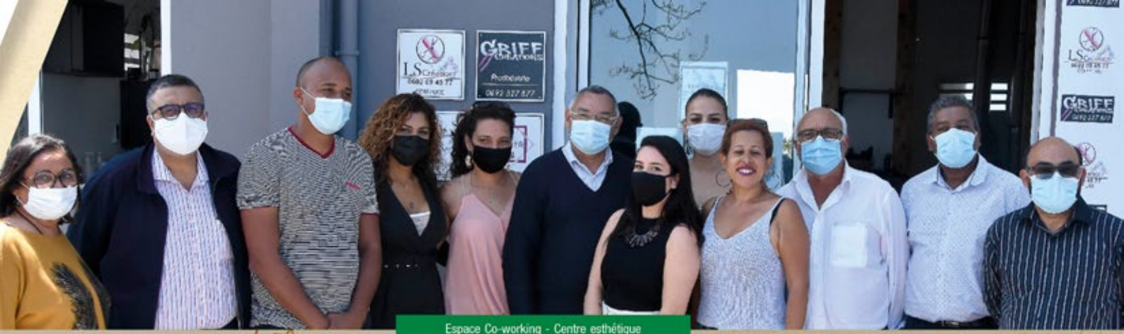
Espace Co-working - Centre esthétique