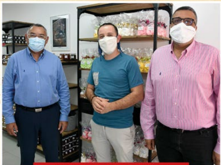
Rémi les Délices de Marine - Saint-Denis